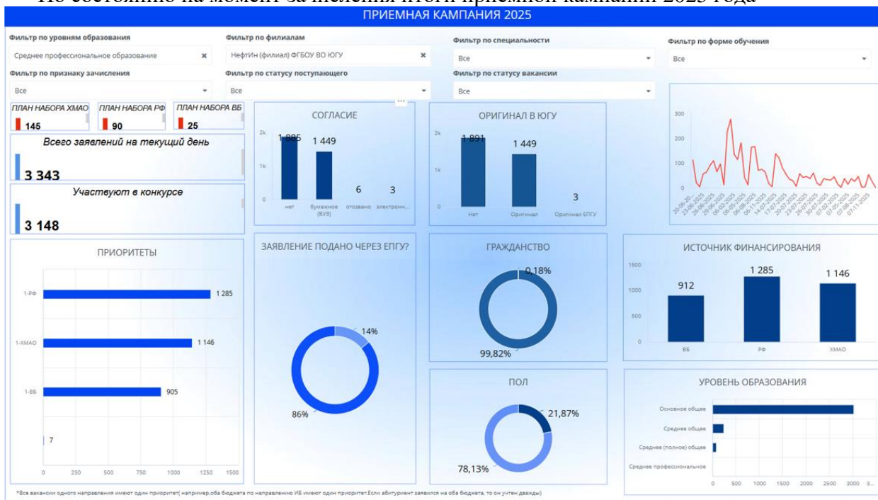
Рисунок 2.2.1-Состояние показателей приемной кампании 2025 на момент зачисления.

По состоянию на момент зачисления итоги приёмной кампании 2025 года