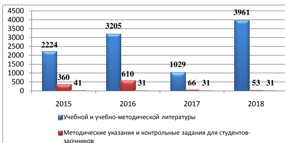
Рисунок 2.6.1 Динамика поступления литературы в библиотечный фонд филиала (в экземплярах)

Подписка на печатные периодические издания осталась на уровне предыдущего года (31 наим.). Также, доступ к периодическим изданиям, обеспечивает ЭБС «Лань».